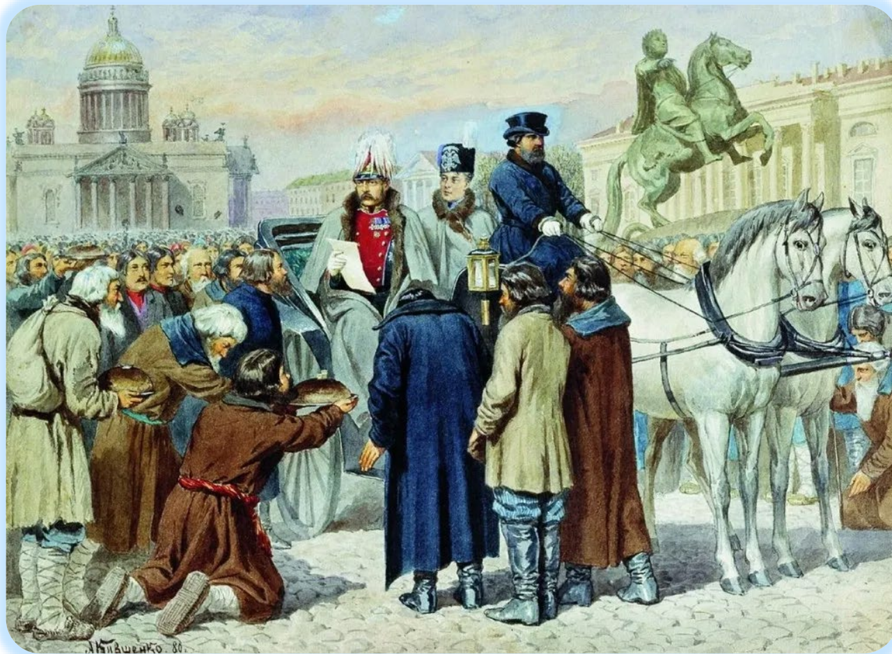
Алексей Кившенко. «Чтение манифеста 1861 года Александром II на Смольной площади в Санкт-Петербурге», 1880